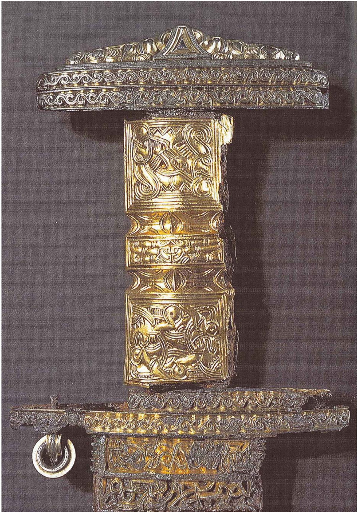
Fig. 2. Snartemosverdet. Etter Rolfsen 2003:88.