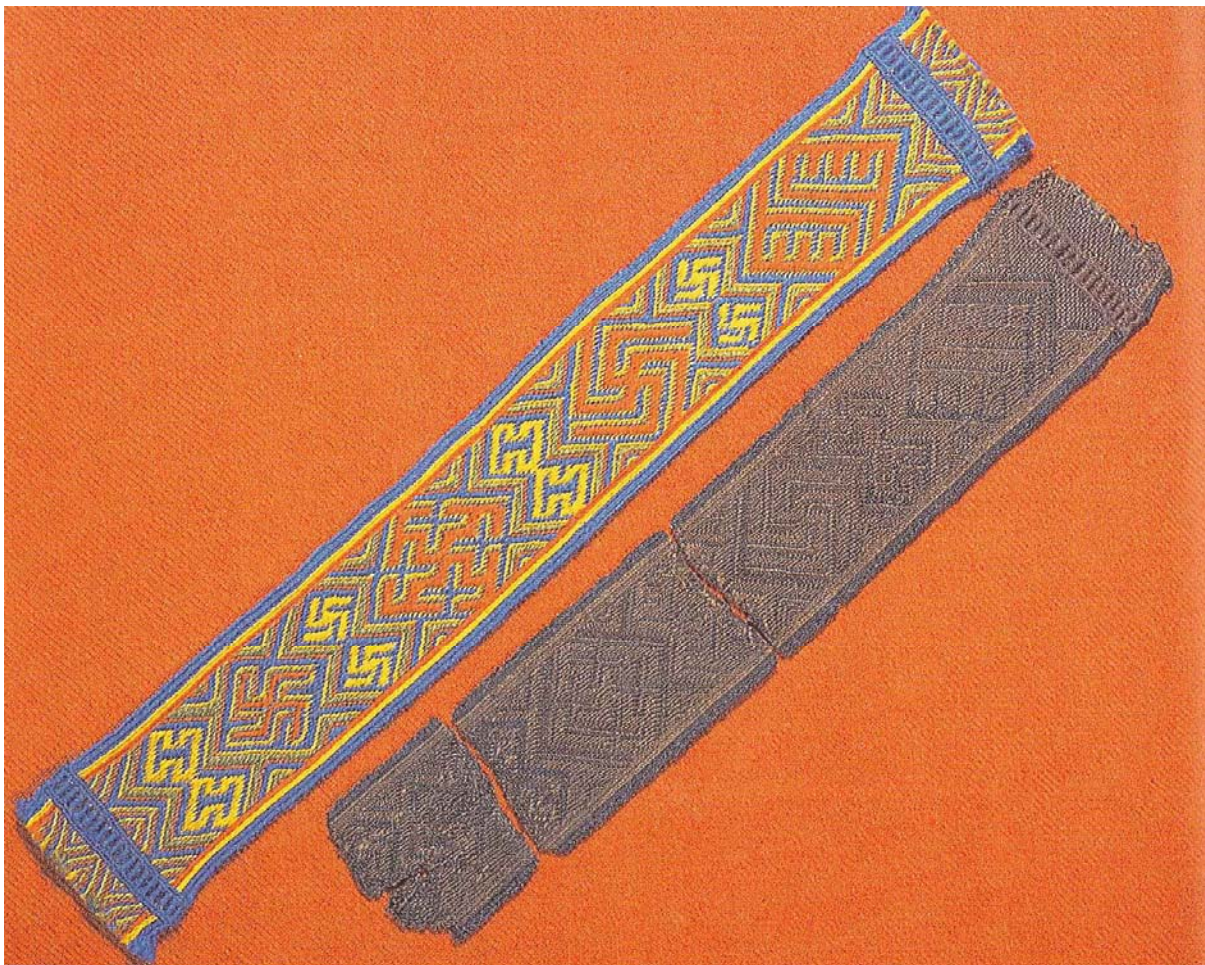
Fig. 3. Brikkevevd bånd med hakekors fra Snartemograven. Etter Parry 2003:90.

Nasjonal samling hadde derimot ikke gitt opp å få Snartemosverdet. I 1942 ville de låne det for å få laget en nøyaktig kopi. Igjen ble bevaringstilstanden brukt som argument mot utlevering, men de fikk lagd en kopi basert på tegninger og fotografier av ornamentikken. Denne kopien ble overrakt Vidkun Quisling 1. februar 1943 på Akershus slott av Arbeidstjenesten. Ved krigens slutt ville Oldsaksamlingen ha denne kopien av Snartemosverdet, men ingen fant det hos Quisling, og 20. juli 1945 ble han i politiavhør spurt om hvor sverdet var. Quisling sa at det var på Gimle, men at hans kone skulle ha det. I 1946 ble det endelig overlevert museet, samme året som det opprinnelige sverdet ble fraktet tilbake til Oslo (Rolfen 2003).